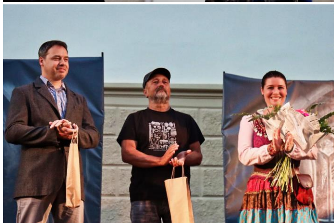
Křest knihy Město Bor a jeho okolí za účasti vedení města Boru a autorů knihy

Velkou návštěvnost letošního 18. ročníku slavností, lze jistě přisuzovat pečlivě připravovanému programu v areálu zámku a zámeckém parku, který oslovil všechny věkové kategorie. Ukončení programu skvostným ohňostrojem, bylo vyvrcholením ukončení letošních slavností. Důležitou roli také hrálo počasí, které bylo příjemné a z větší části slunečné.