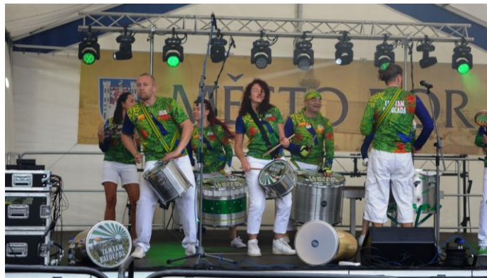
Tam Tam Batucada