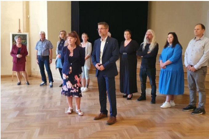
Vernisáž k výstavě Klubu výtvarníků Borska v zámku

období školních prázdnin a slunečných dovolených je za námi. Nový školní rok byl zahájen, děti se vrátily do školních lavic a ty mladší do mateřské školy. Město dnes může vzpomínat na proběhlé Loretánské slavnosti , jednu z významných každoročně se opakujících akcí. Program letošního 32. ročníku oslav byl pečlivě připraven tak, aby oslovil různé věkové kategorie. Zpestřením programu byla páteční vernisáž výstavy Klubu výtvarníků Borska, která byla uspořádána na zámku ve Velkém sále k 25. výročí založení klubu. Výstava potrvá do 9. 10. 2022.