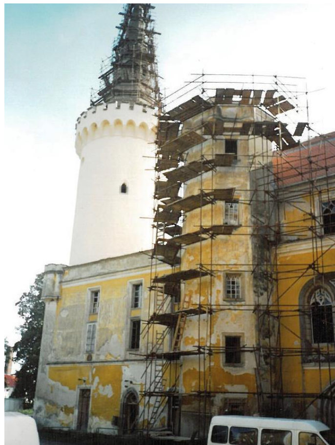
Oprava zámeckého křídla v roce 2001 přinesla první vlaštovky v obnově a naději, že přece jen zámek „přežije“.