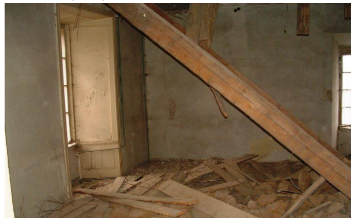
Propadlé stropy v knížecích salóncích v prvním patře.