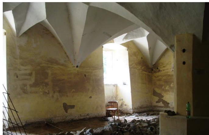
Svamberský sál před obnovou.