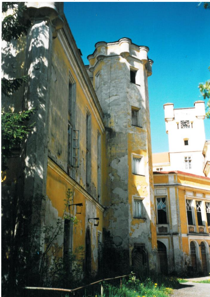
Takto už zámek nechceme nikdy vidět, fotografie byla pořízena v roce 1996, tedy rok před navrácením do vlastnictví města a zahájením celkové rekonstrukce zámku.