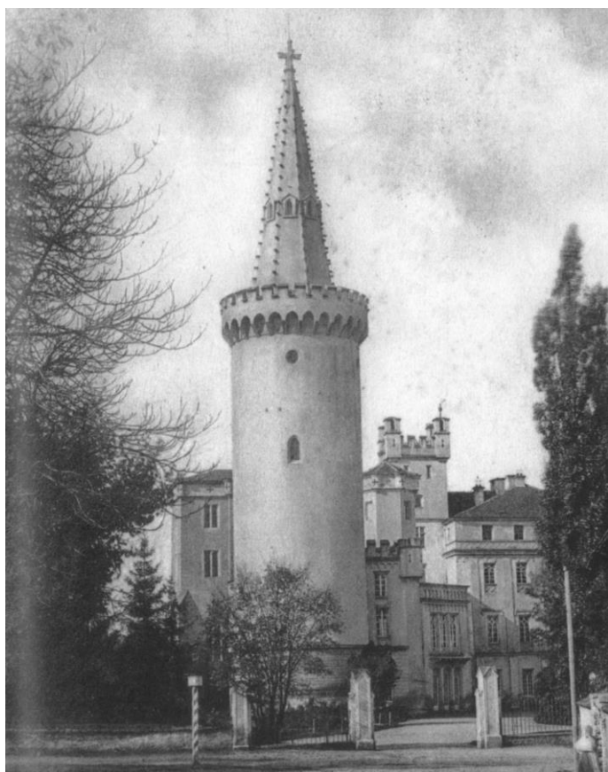
Zámek Bor kolem r. 1900, kdy jej vlastnili Löwensteinové

Když v roce 1945 odešli ze zámku jeho poslední šlechtičtí majitelé – Löwensteinové, bylo započato s jeho zkázou. První léta po válce byla ve znamení ničení a rabování, zámek přecházel z jedné správy do druhé, a pokaždé bylo víc a víc ničeno, přestavováno a přesouváno. Ani částečná oprava v šedesátých letech nepomohla tomu, aby se duše zámku pomalu a jistě propadala hluboko do zapomnění, neboť většina stavebních prací byla prováděna bez ohledu na historické hodnoty. Bylo zde zřízeno učiliště s internátem a k tomu také jídelna a část zámku sloužila jako kulturní zařízení. Bylo tomu tak do osmdesátých let 20. století, kdy se stav zámku natolik zhoršil, že byl všemi provozy a organizacemi opuštěn a ponechán svému osudu. To však nebylo nic proti tomu, co přišlo po roce 1990 ... kdy se zámek dostal do svízelné situace díky podvodné transakci nových majitelů (soukromé společnosti), přestal být zcela udržován a začal velice rychle chátrat. Tento nepříznivý stav trval až do roku 1997. Zámek byl na pokraji celkové devastace, a jen díky snahám města a možnosti získat dotace z Evropské unie, bylo započato s jeho celkovou rekonstrukcí.