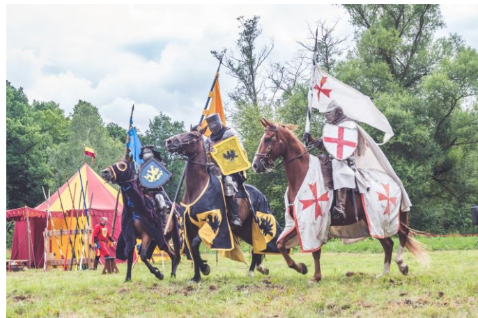
Turnaj na koních v zámeckém parku skupiny Kvintána.