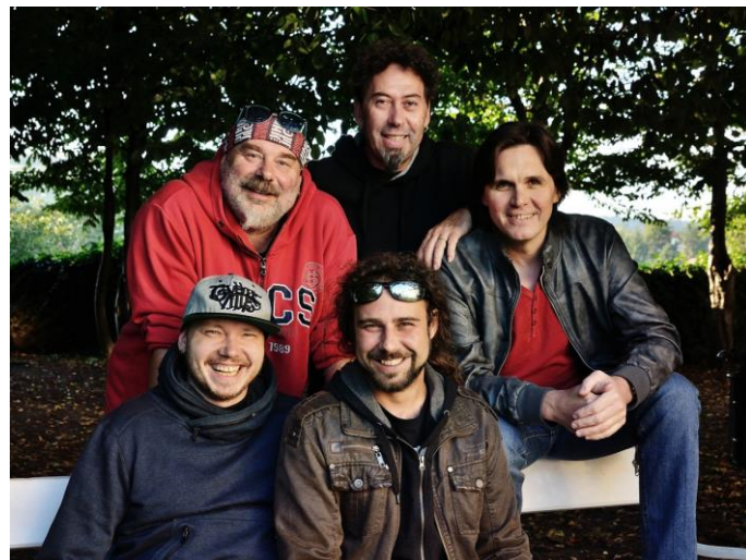
Skupina Fleret bude jedním z hostů Loretánských slavností