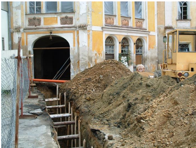
Úpravy nádvoří během rekonstrukce v roce 2005.