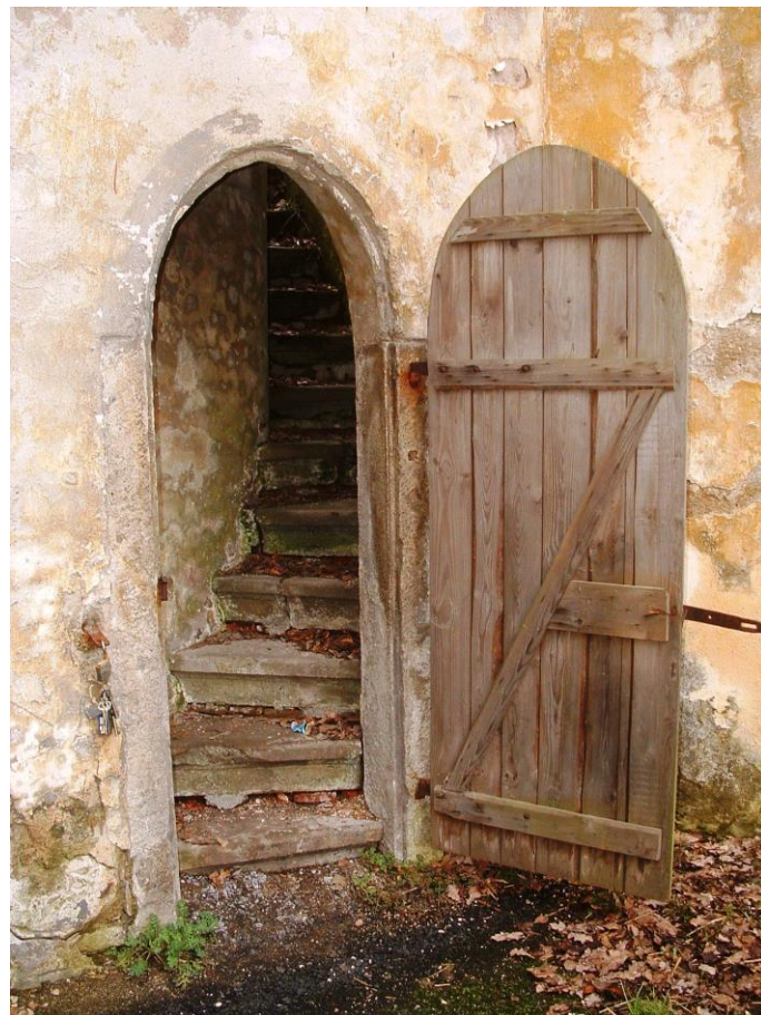
Zámecké zákoutí s tajemnými schody, které ještě čeká na obnovu, ale věříme, že bude vyhledávaným místem návštěvníků a nabídne krásný výhled do zámeckého parku.

Borský zámek přežil několik středověkých útoků, dvě světové války, éru pracujícího lidu, porevoluční podvodný prodej, ... nyní už je na nás a dalších generacích, aby tato nepřehlédnutelná dominanta Boru zůstala zachována a mohla vypovídat o své skoro osmisetleté historii.