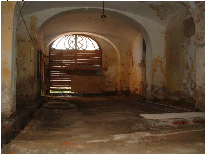
Vstupní hala zámku po vyklizení před zahájením obnovy.