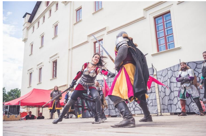
Rytířský turnaj skupiny Arthur Thor.

14. ročník Zámeckých historických slavností je za námi. Několika fotografiemi připomínáme, jak celý slavnostní festival šermu, tance a hudby proběhl. Děkujeme všem návštěvníkům, že dorazili v tak hojném počtu, a samozřejmě velké poděkování patří všem účinkujícím, kteří se do borského zámku sjeli ze všech možných končin naší vlasti.