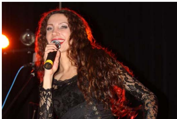
Hostem prvního plesu byla zpěvačka Olga Lounová