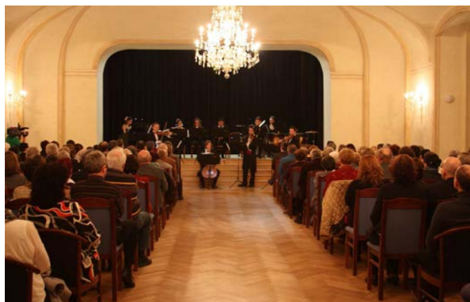
Mezinárodní koncert v zámeckém sále

V sále se uskutečnilo několik akcí, jednak slavnostní zahájení za účasti mnoha hostů, ale také dva plesy, mezinárodní koncert a v rámci zahájení turistických prohlídek byl zahrnut do prohlídkového okruhu.