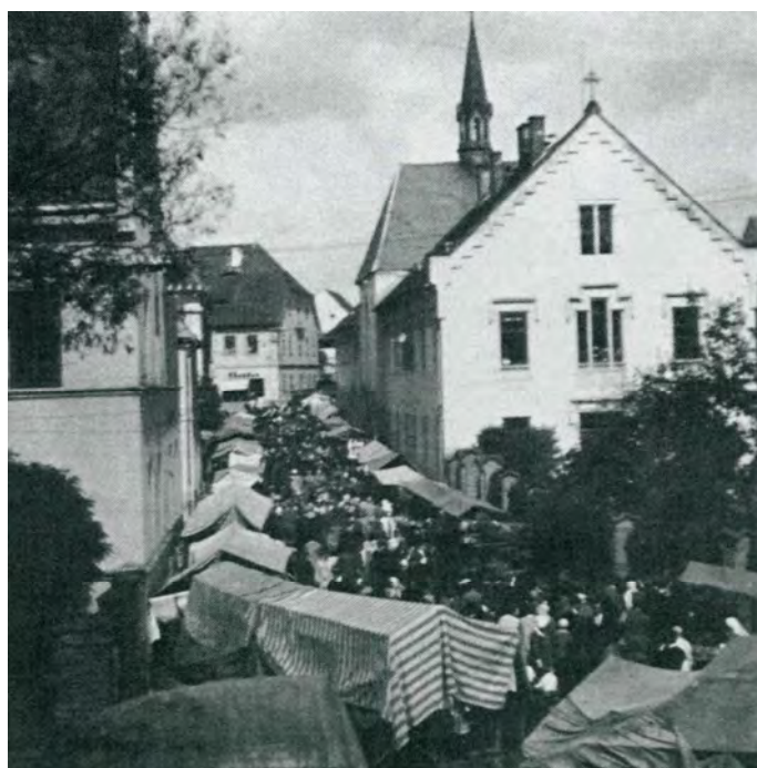
Loretánský trh dne 8. září 1931 (fotografie z knihy Haid und Haider Land)

Borská svatá chýše byla postavena jako prostá stavba z barokního smíšeného zdiva a svou původní podobu si dochovala až do dnešních dnů. Po svém vysvěcení sloužila jako poutní místo téměř 20 let. Nejvýznamnější místností lorety je vlastní kaple Milosti, její stěny jsou velmi silné a jen malé světélko pouští dovnitř světlo. V letech 1685 – 1688 byly kolem svaté chýše postaveny ambity, které svými čtyřmi křídly uzavřely nádvoří, jehož střed právě tvořila svatá chýše. Ambity ukazují křížovou cestu. V loretě jsou dvě kaple, P.Marie Čenstochovské a P. Marie Klatovské.