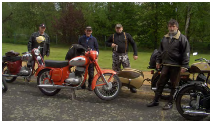
14.5.2014 - Účast na veteránské soutěži ve Stříbrě