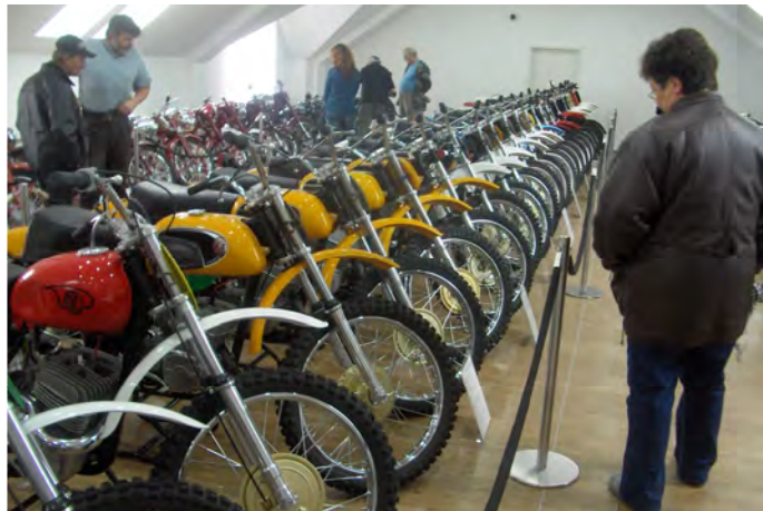
28.9.2010 - Návštěva muzea motocyklů v Chlumčanech