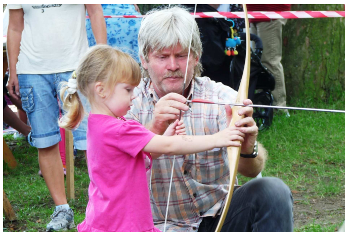
Fotografie z akce „Ahoj, prázdniny“