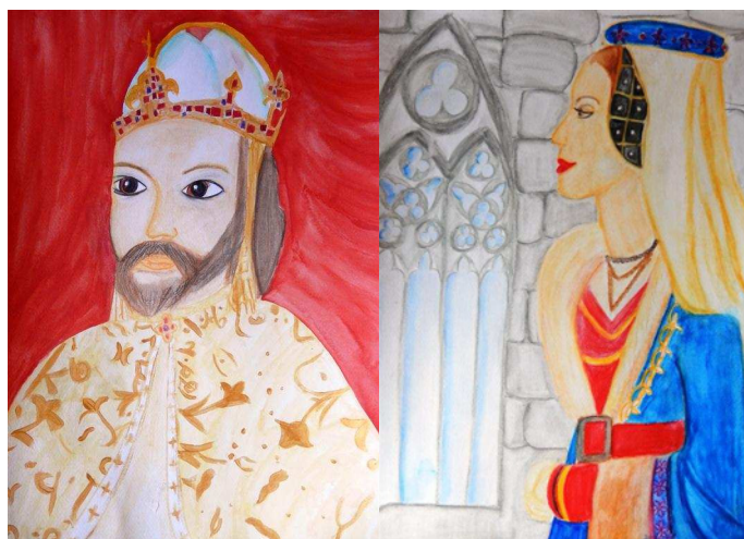
Vendy Frymlová, 10 let (2. kat.)