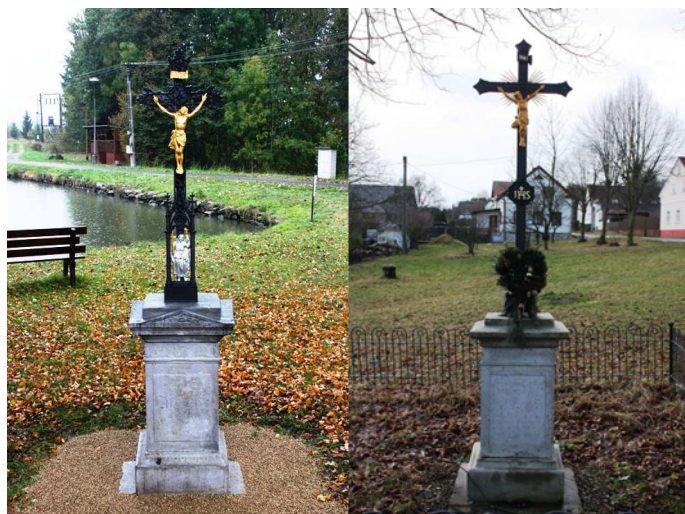
Památníčky s litinovým křížem po své obnově v obcích Ostrov a Kosov