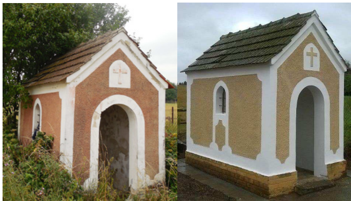
Stav kaple Panny Marie u obce Lužná před obnovou a po obnově v roce 2015. V letošním roce se počítá ještě s osazením památníčku vedle kaple, který byl nalezen v křoví za kaplí během stavebních úprav.