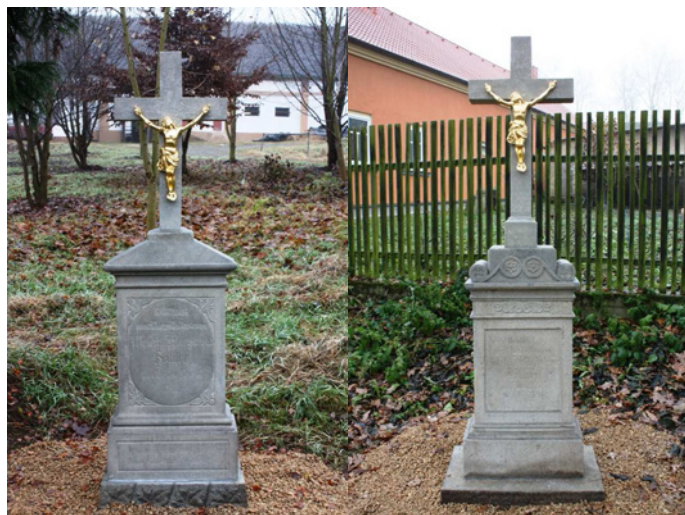
Další dva památníčky byly opraveny v obci Dolý