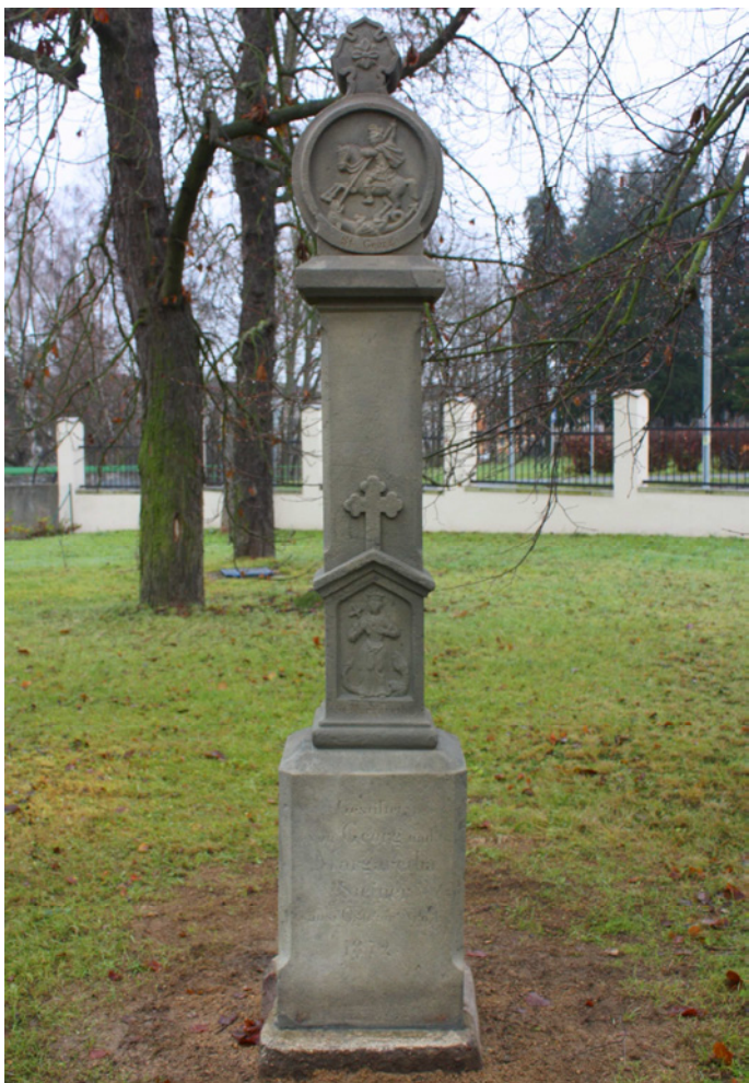
Památník sv. Jiří a sv. Markéty byl obnoven v roce 2011, nyní se nachází v areálu zámku v Boru, na horním nádvoří, 30 m za vstupem hlavní brány.

Památník sv. Jiří a sv. Markéty stál původně v obci Ostrov, poté co byl poškozen byl převezen do depozitáře zámku Bor, obnoven a nově postaven v areálu zámku, kde už mu snad žádná zkáza nehrozí.