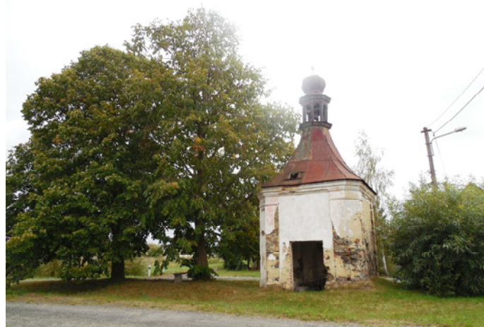
Kaple Korunování Panny Marie ve Lhotě pochází z 18. století (kaple je zakreslena již na mapě Stabliního katastru z roku 1838) – současný stav

V letošním roce nás čeká náročná obnova kaple ve Lhotě, a doufáme, že i v dalších letech budeme díky dotacím pokračovat v dalších obnovách drobných staveb v našem městě, v místních částech a blízkém okolí.