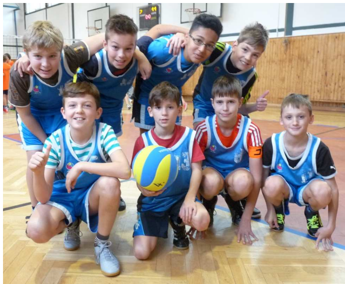
Tým žáků z 5. tříd ZŠ Bor – okresní přeborníci v přehazované

Přeboru v přehazované žáků 4. a 5. tříd se v Tachově zúčastnilo osm týmů. Borští ve skupině postupně porazili 2:0 Bezdruzice a Stráž, 2:1 ZŠ Zářečná Tachov, v semifinále po strhujícím boji 2:1 (12:10, 6:11, 11:4) ZŠ Mánesova Stříbro. Turnaj měl výbornou atmosféru a kolektiv se vzájemně podporovaly. Finále bylo opravdovým vrcholem. Platilo příznačné: „Každý chvíli tahá pilku.“ Sady se hrály do jedenácti bodů. Ve třetím rozhodujícím setu vedla ZŠ Hornická Tachov 9:3 a zdálo se, že je rozhodnuto. Time-out vlil nové sebevědomí. Borští kluci dokázali otočit průběh na 10:9. Bod od vítězství byl i kolektiv z Hornické, mečbol střídal mečbol. Štěstěna se nakonec přiklonila na naši stranu. Rozhodující set jsme vyhráli 13:11.