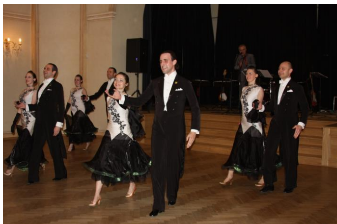
Na Městském bále se během večera představil StandardKlub Praha se svým Vídeňským valčíkem.