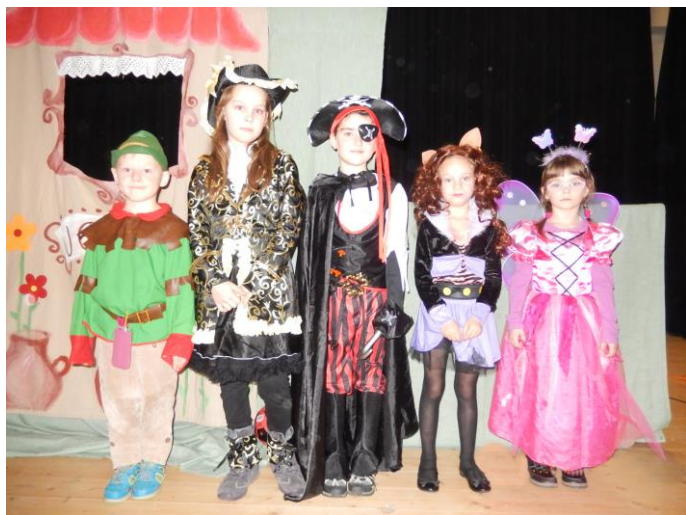
Dětský karneval má mezi dětmi i rodiči oblibu, svědčí o tom zcela zaplněný zámecký sál. Na snímku jsou děti, které porota ocenila za krásné kostýmy.