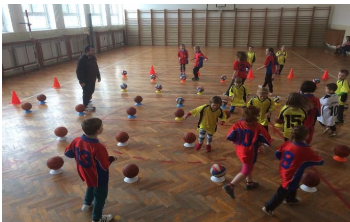
Pohybové aktivity v tělocvičně ZŠ v Boru

V současné době již probíhá v Boru doplňkový kroužek akademie, pohybové aktivity, kde momentálně evidujeme 42 členů (chlapci a dívky ročník 2013-2005). Momentálně jsou dvě skupiny, ale pro velký zájem se budeme snažit udělat skupinu třetí. V tomto kroužku děti plní různá průpravná cvičení, překážkové dráhy a hry zaměřené na orientaci v časoprostorovém pásmu. Kdo by měl zájem k nám přidat dalšího sportovce, sportovkyni, tak se informujte u pana Šlehofera na tel. 722133592.