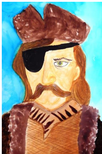
Autor: Jakub Volf