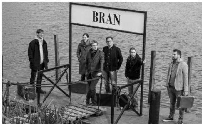
Páteční program na náměstí obohatí skupina Bran

Páteční program bude zahájen odhalením historického milníku za účasti konšelů města a hostů, následovat bude koncert známé hudební skupiny Bran a příchod průvodu ze zámku.