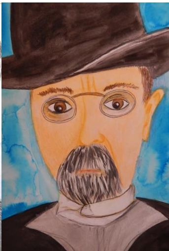
Autor: Agáta Becková