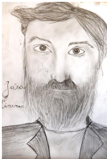
Autor: Tereza Stejskalová