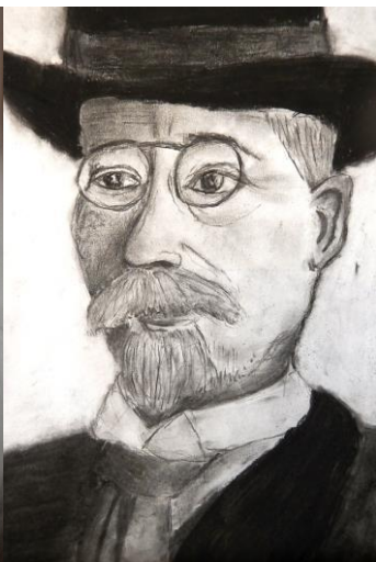
Autor: Barbora Horáková