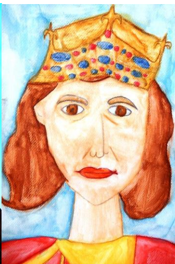
Autor: Veronika Krýsllová