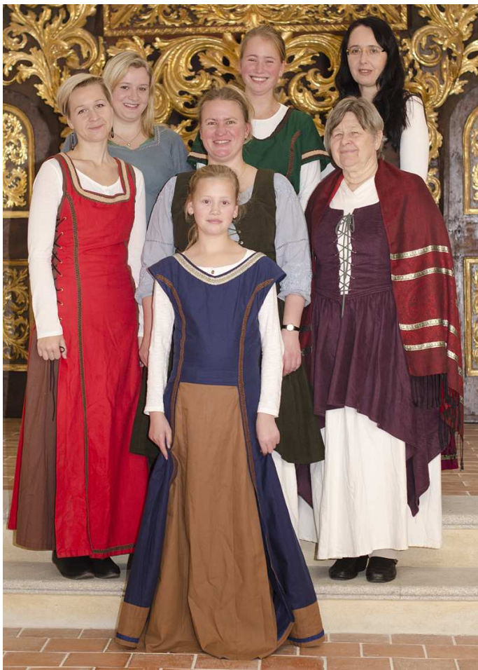
SBOR z chrámu sv. Mikuláše vystoupil v kapli sv. Vavřince.