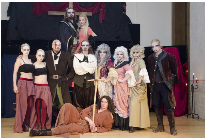
Skupiny Korbel a Mericia předvedly vystoupení o krvežíz- nivém hraběti Draculovi.