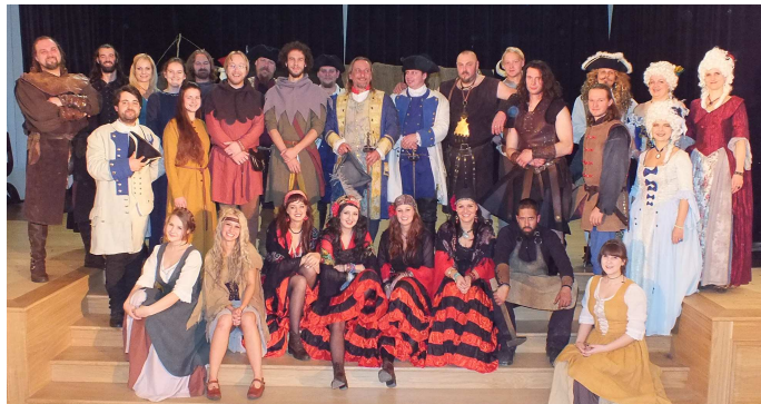
Společné foto všech účinkujících ve Velkém sále