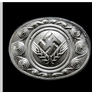
Odznaky Říšské pracovní služby pro dívčí mládež (RADWJ)