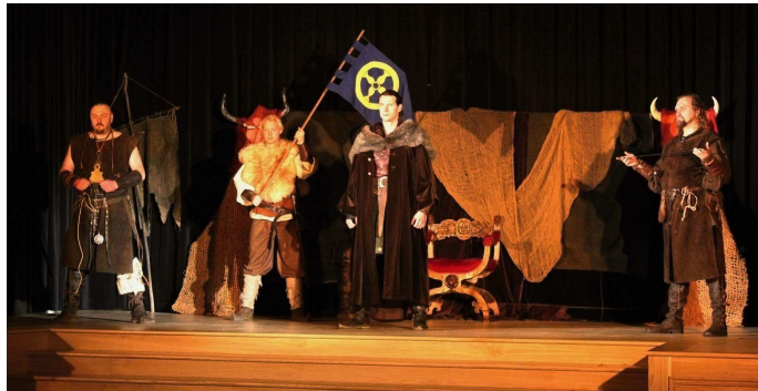
Skupina Korbel a jejich příběh z temného středověku

Tradiční zámecká akce, kterou správa zámku zakončuje turistickou sezónou se konala 7. listopadu. Stejně jako v předešlých letech byly předem vyprodány všechny vstupenky. Návštěvníci slyšeli středověké písně skupiny Elthin, do období rokoka je zavedla skupina Balteus, naopak do nejstarších časů se diváci mohli přenést díky skupinám Korbel a Equites a na motivy muzikálu Carmen zatančila skupina Mericia. Kromě těchto vystoupení mohli návštěvníci prohlídek obdivovat umění kováře a sami si toto řemeslo vyzkoušet.