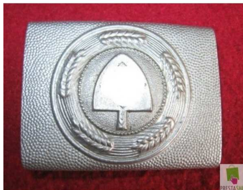
Přezka chlapeckého pásku RAD

Zákon o Říšské pracovní službě (RAD) stanovil pracovní povinnost všem mužům árijského původu, tělesně a duševně schopných, ve věkové kategorii 18 až 25 let. Účast mladých žen byla zprvu dobrovolná, ale vstupem Německa do války 1. září 1939 byla i pro ně povinná. Dobrovolný vstup byl povolen chlapcům od šestnácti a půl let a dívkám od sedmnácti let.