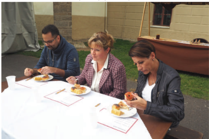
Porota měla nelehký úkol, vybrat nejlahodnější jablečný nebo medový pokrm