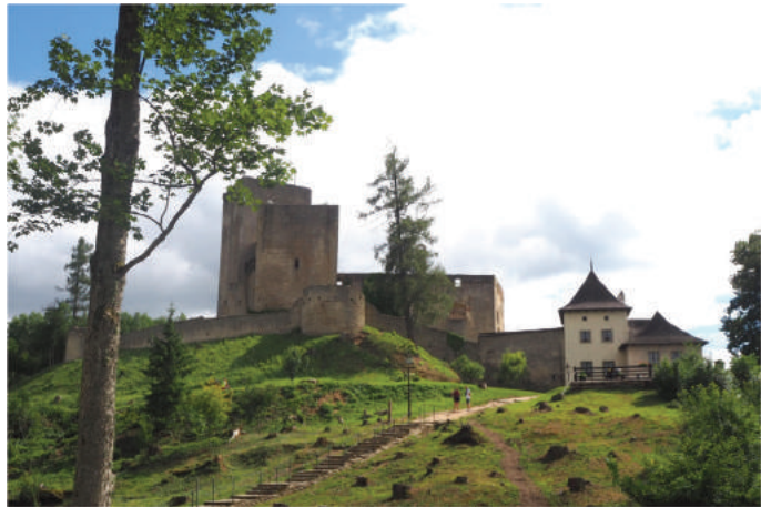
Romantická zřícenina hradu Landštejn