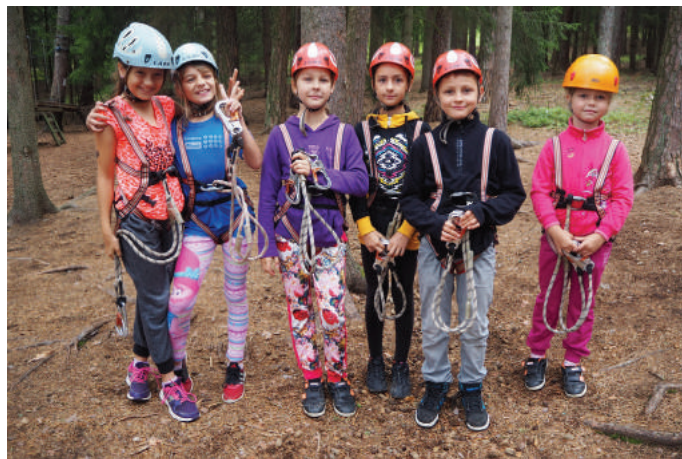
Pro menší děti byla připravena nižší lanová dráha, ale i ony musely absolvovat přípravy a zajištění v úvazcích