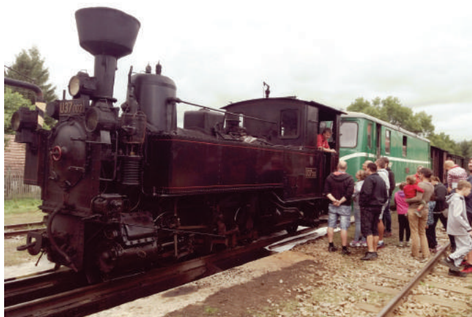
Projížďka po úzkokolejce parním vlakem z Jindřichova Hradce do Nové Bystřice byla pěkným zážitkem

Tradiční prázdninový zájezd se konal ve dnech 12. – 13. srpna a zavedl borské děti a jejich rodiče a prarodiče do tzv. České Kanady. Nejdříve se všichni projeli parním vlakem po úzkokolejce z Jindřichova Hradce do Nové Bystřice , poté si prohlédli velmi krásnou zříceninu hradu Landštejn a sobotní putování bylo zakončeno ubytováním v chatičkách v Cyklocampu pod Landštejnem . Druhý den ráno po snídani čekal na účastníky zájezdu lanový park, pro menší děti malý okruh v nízké výšce, pro větší děti a dospělé velký okruh na vyšších překážkách. Děti byly nadšené, dospělí znavení a pro většinu to bylo velmi adrenalinové a zábavné dopoledne. Po obědě čekala výletníky prohlídka města a zámku Třeboň a zpáteční cesta do Boru. Výlet byl povedený, přálo krásné počasí a účastníci viděli další část české krajiny.