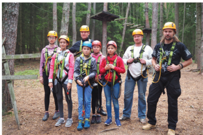
Adrenalinová zábava v lanovém parku, na vysoké lanové překážky si troufaly starší děti i tři tatínkové