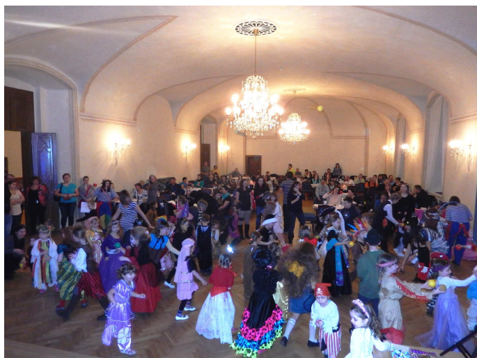
Dětský karneval má mezi dětmi i rodiči oblibu, svědčí o tom zcela zaplněný zámecký sál a dovádění dětí.

Nyní bude zámecký sál součástí prohlídkového okruhu pro návštěvníky, ale budou zde uspořádány výstavy a také ještě akce pro děti s názvem Ples pro rytíře a princezny na konci měsíce května.