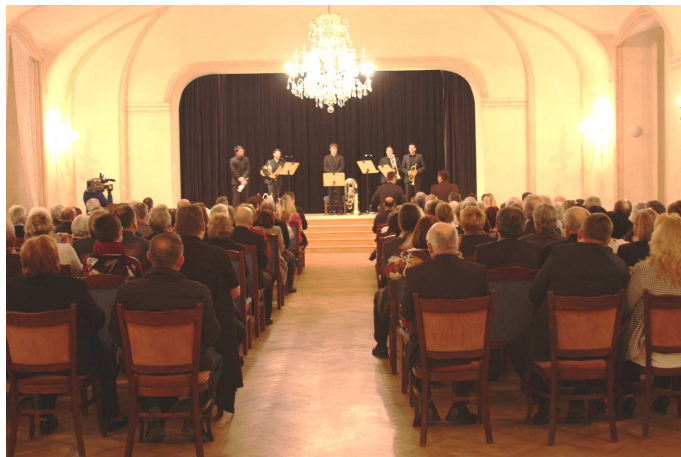
Velký sál zámku Bor při koncertu