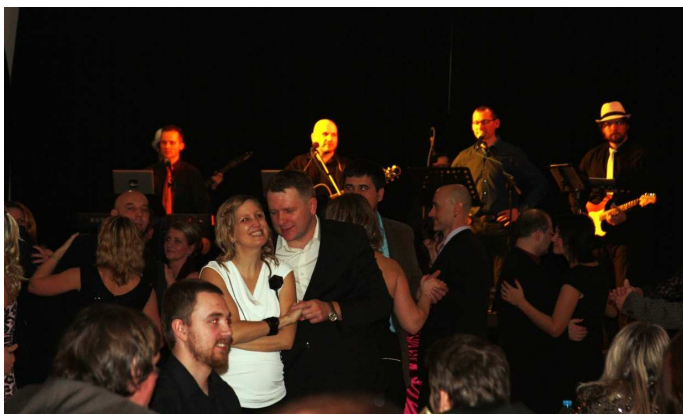
Ples sportovců zakončil zámeckou plesovou sezónou.

V pátek 1. dubna bude zahájena již třináctá turistická sezóna v našem zámku, slavnostní zahájení proběhne v neděli 3. dubna, kdy se v zámku uskuteční divadelní představení Klíče na neděli s Lukášem Langmajerem v hlavní roli.