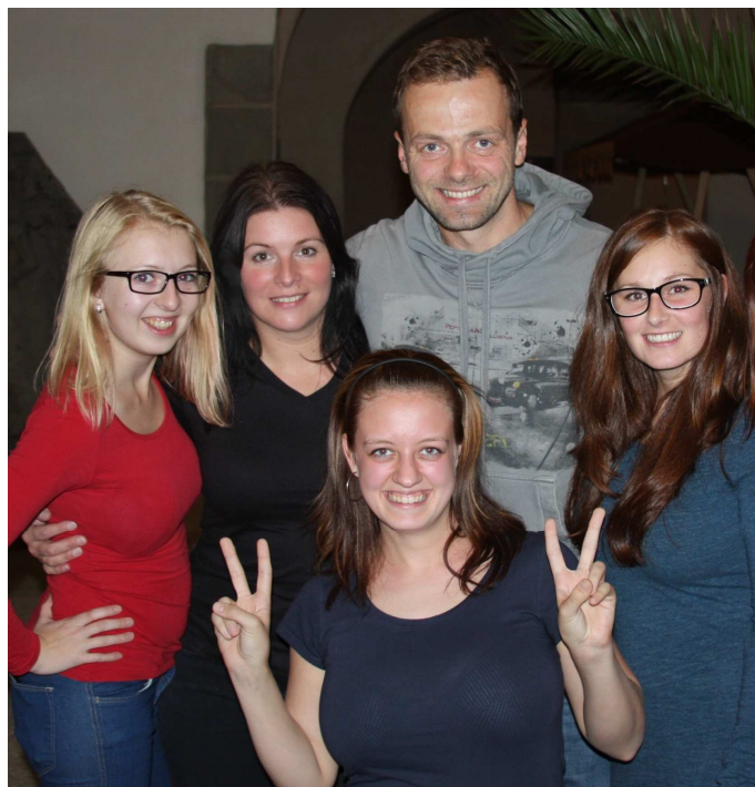
V říjnu zavítala do našeho zámku divadelní společnost Pluto z Plzně s komedií Paparazzi, kde hlavní roli ztvárnil Lukáš Langmajer. Představení sklidilo velký úspěch a Lukáš Langmajer byl spokojený nejen se skvělým publikem, ale líbil se mu také náš zámek, který si prohlédl v doprovodu kastelánky a zámeckých průvodkyň.