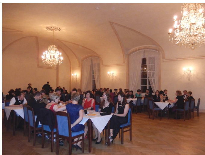
Městský bál se uskutečnil v půlce února, tradice městských plesů byla po dlouhé době opět obnovena v roce 2011, kdy se tančilo v sále Střední školy v Boru.