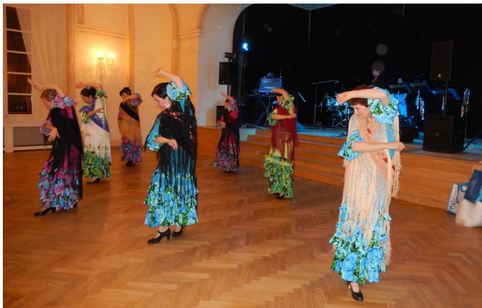
Ples zdravotníku obohatily svým vystoupením tanečnice flamenga ze skupiny Flemenkítas Plzeň.