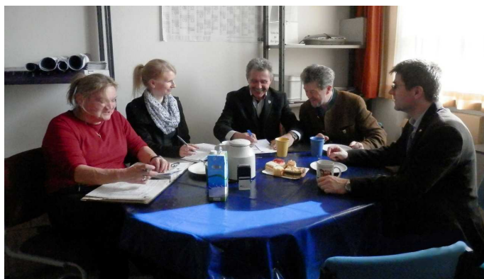
Společné setkání organizátorů koncertu v Pleysteinu

Díky profesionálnímu vystupování hudebníků, se tak každým rokem rozeznává významná dominanta našeho Města Boru.