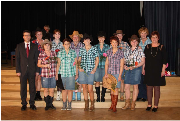
Country skupina Sebranka na společné fotografii se starostou a místostarostkou města

Věřím, že se oslava MDŽ s našimi seniory vydařila a všichni jsme se dobře bavili a měli možnost si i společně zatancovat.